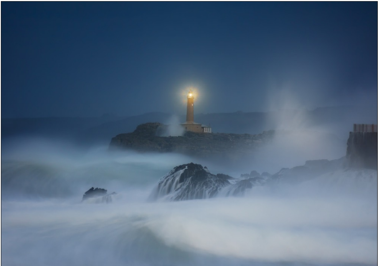
Foto Mouro lighthouse in Santander at night

Gerardo Joaquin Laempe - 23. Februar 2017